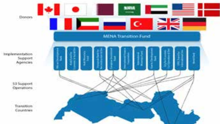
Source : Mena transition fund